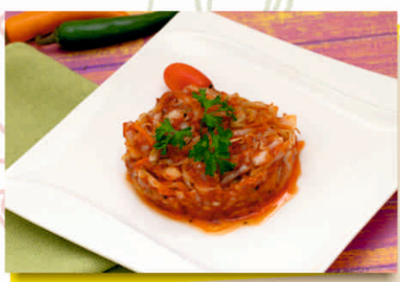
Квашеная капуста, тушеная в томате (250 гр.) 900т.