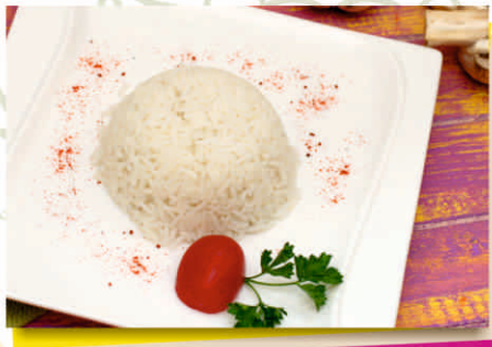
Рис прилушенный (150 гр.) 900т.