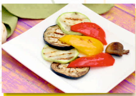
Овощи гриль (200 гр.) 900т.