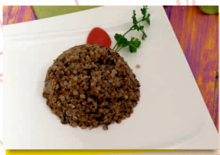
- Гречка - Гречка с грибами (150 / 200 гр.) 900т.