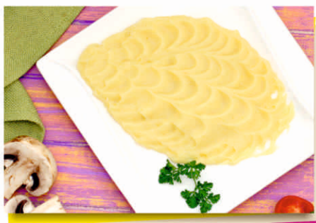
Картофельное пюре (250 гр.) 900т.